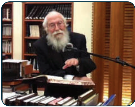
שיעורים עשירים בלי הכנה. הגר"נ במסירת טוב התורה

נשאיר לרגע את שיחתן של האם והבת בצד, ונדלג שעה קדימה, ל-12:10: כאשר השכנים חזרו לביתם. עומסי תנועה ועיכובים נוספים איחרו אותם עד עכשיו, וטרם עידן הסלולרי לא יכלו אף לעדכן את הגולדברגים על האיחור.