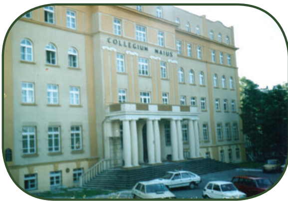
השתוקקו להגיע לאומן. כאן, ב"ל, התקיים הקיבוץ בפולין