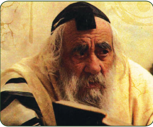
לא נוגע בכסף! ה"סטייפלר" מרים את עיניו הטהורות מן הספר

"התקרב פורים" המשיך ההוא מעבר לקו, "ומאחר וכל שנה אנו שולחים ל"קהילות יעקב" כספי מתנות לאביונים, ואת אחי אינני יכול לשאול מאחר ואני ב"תענית דיבור" עמו, גמרתי בדעתי שאחי ודאי מסכים לשלוח גם השנה. לקחתי מכספי העיזבון המשותף עשרים אלף דולר ושלחתי בני-ברקה.