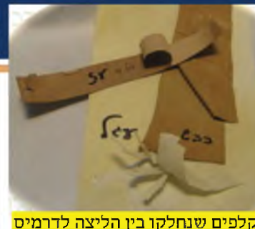
קלפים שנחלקו בין הליצה לדרמיס

והרי בזמן הראשונים גירדו הרבה מצד השערות, ובכל זאת הכשירוהו. ואף לשיטות שגירדו מעט, מכל מקום ה'ליצה' קולפה לחלוטין. ומה שטוענים המחמירים לאסור על פי דברי הנשמת אדם, אינו נראה, כיון שכל המושג של 'ליצה' הוא דבר חדש, שלא מצאנו כן בדברי הראשונים והאחרונים, והנשמת אדם דיבר כאשר מגרד את הקלף עצמו, ולא כאשר מוריד דבר דק כמין קרום של ביצה, שודאי אינו מגרע את שם הקלף.