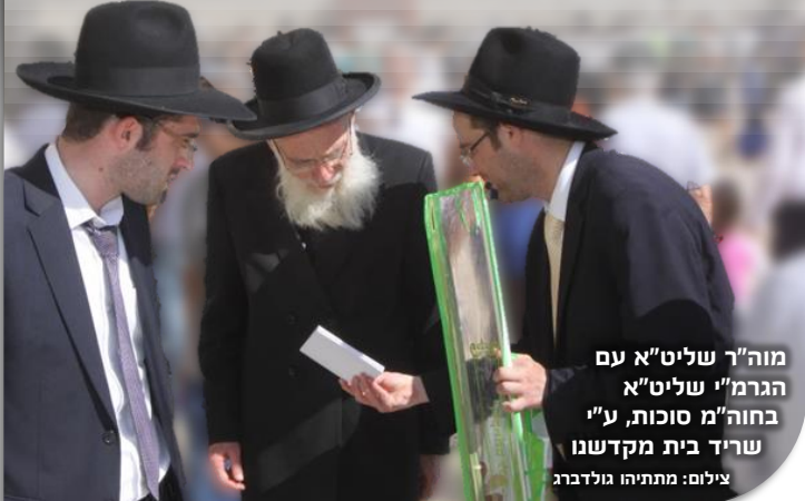
מוה"ר שליט"א עם הגרמ"י שליט"א בחוה"מ סוכות, ע"י שחר בית מקדשנו

ואציין בדרך אגב, כי שבועות ספורים לפני הסתלקותה של הרבנית שלינגר, היתה מאושפזת בבית החולים, והתלווית אל אבי כשהלך לבקרה. בתום הביקור ביקש אבי להבדיל בין חיים לחיים מהרבנית נ"ה שתברך אותו, והיא השיבה בצניעות ועונה: "וכי חסר לך ממי לבקש ברכות?! סיפר לה אבי את ששמע עליה מהרב מפוניבז', אז נעתרה לברכו.