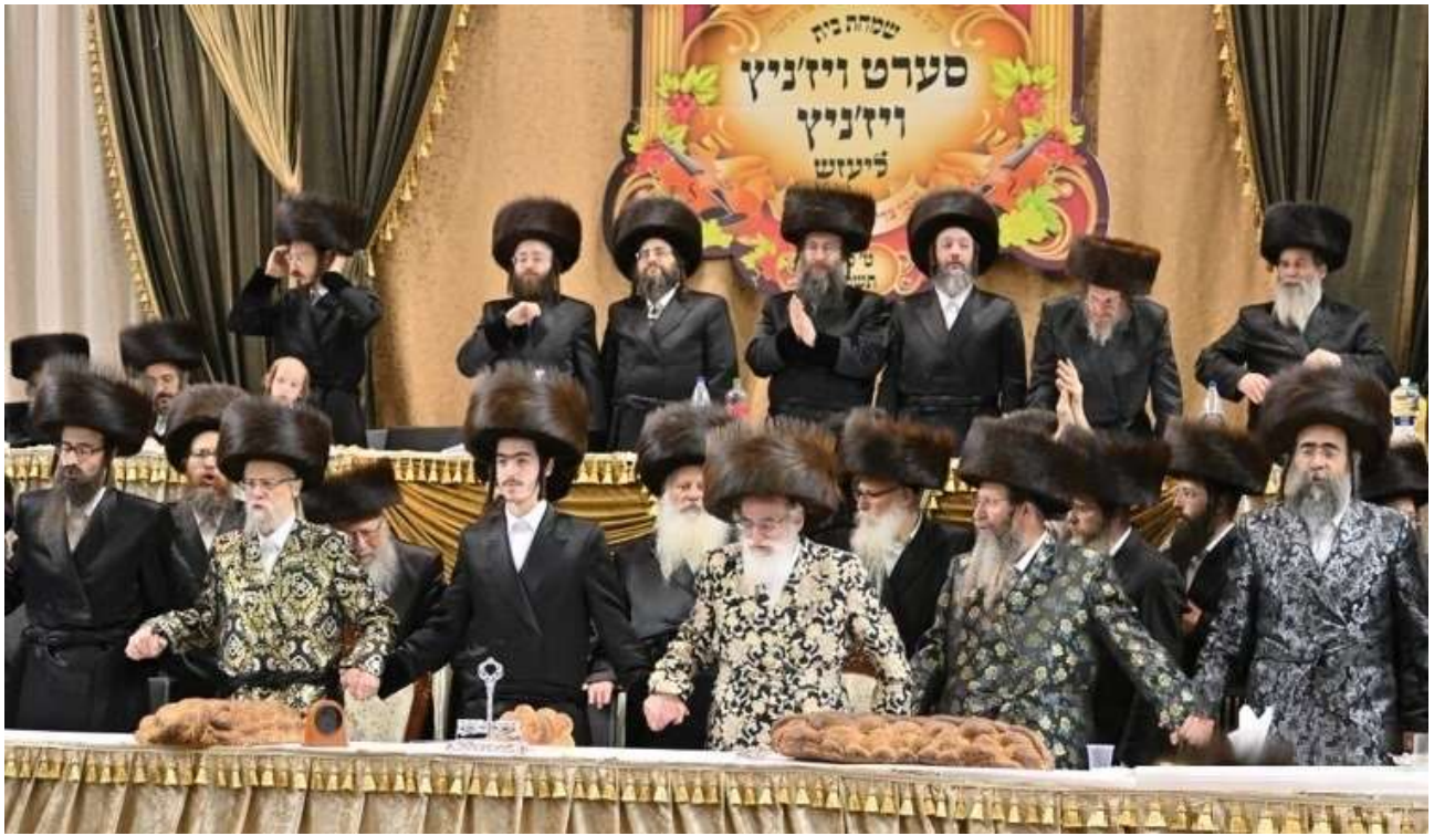
ריקוד בסעודת המצוה