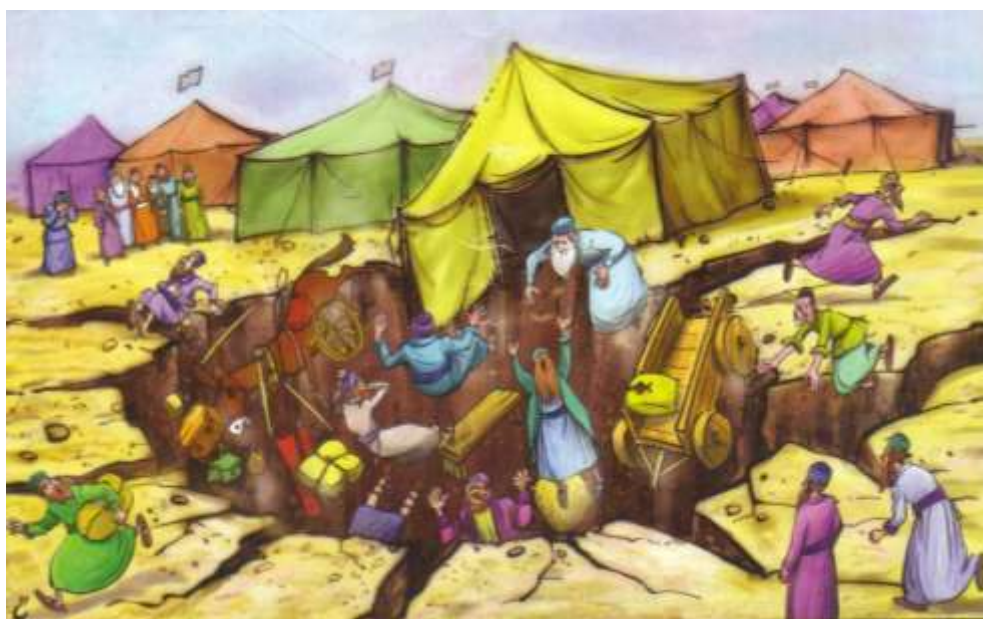
בליעת קורח ועדתו