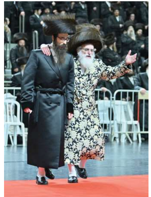
בשמחת ה'שבע ברכות'