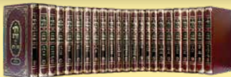
פורמט רגיל [cm 24/17]