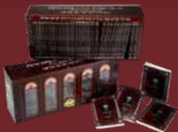
פורמט ביס "ובלכתך בדרך" מהדורת ר' יוסף צבי בערגער [cm 16.5/11.5]