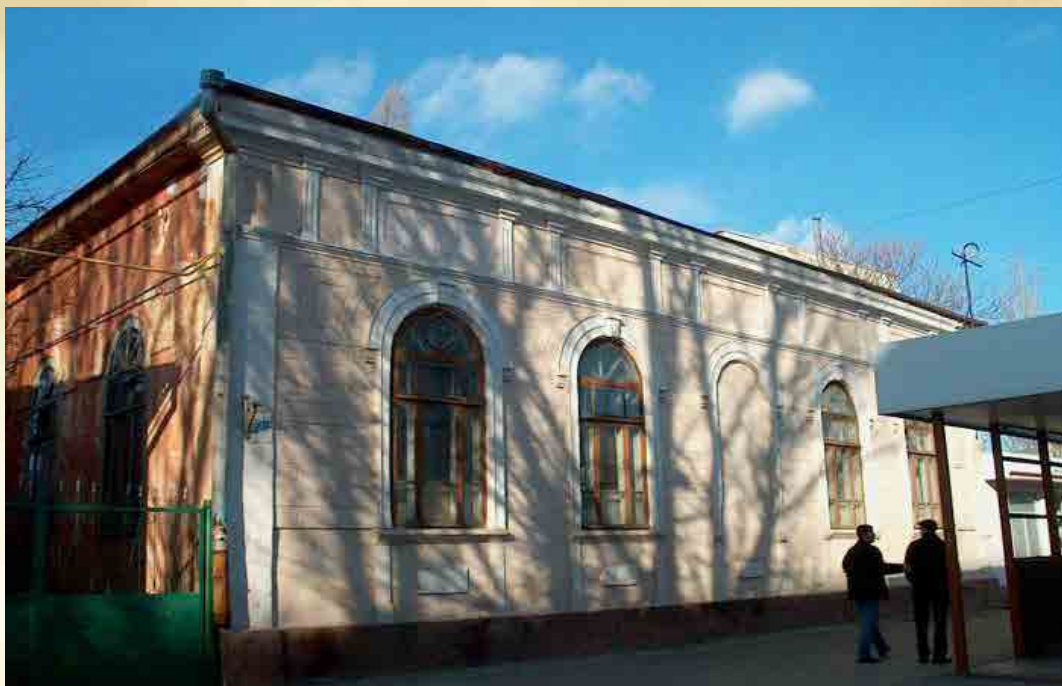
קלויז חסידי סאדיגורה בעיר בענדער