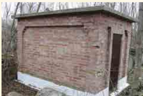
אחד האהלים של הצדיקים הטמונים בבית העלמין בבענדער