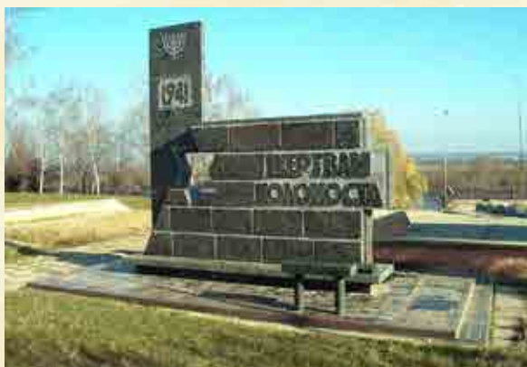
מצבת זכרון לשרידי הנרצחים בשנות השואה בבית העלמין בעיר בענדער

שמעו מהציפורים העפות מחוץ לחלון, שהמחותנים מהעולם העליון כבר הולכים לחופה, והחל הרבי שלום הגדול גם הוא ללכת עם גיסו להחופה.