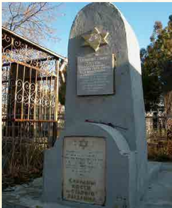
מצבת העצמות שפנו מביית העלמין הישן בו היה טמון הרה"ק מבענדער על מצבת האבן נכתב לזכרון: "העצמות היבשות שנלקטו מביית הקברות הישן עיר בענדער ת.נ.צ.ב.ה."