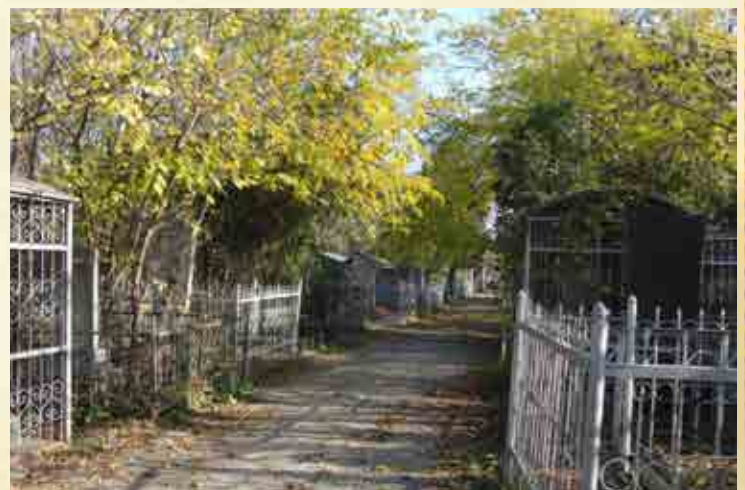
שבילים בבית העלמין בבענדער

אחר כך בא שוב פעם שליח ואמר להרבי שלום הגדול כי המחותרים