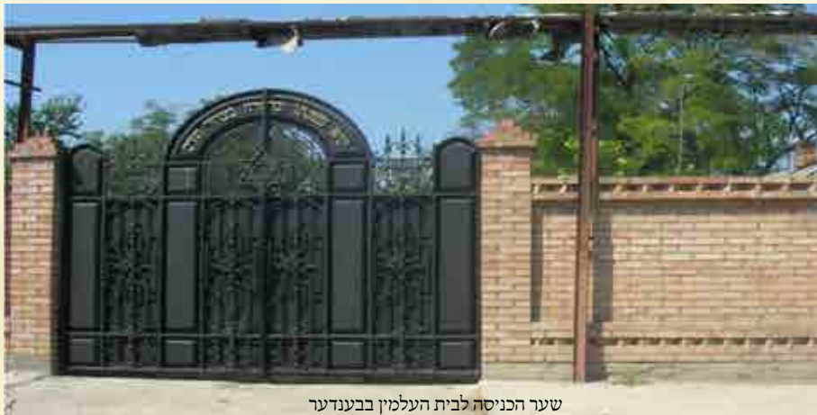
שער הכניסה לבית העלמין בבענדער

בקשר אמיץ וחזק, עוד בעת שישבו יחד סמוכים על שלחן חותנםזקנים הרה"צ הקדוש הרבי נחום מטשערנאביל זכרונו לחיי העולם הבא. ופעם אחת קרה במוצאי שבת קודש ישב בבית מורו הרבי שלום הנ"ל, ויתמהמה עד בוש, והיה כמה שעות בלילה, עד שהתחיל מורו הנ"ל לקרות קריאת שמע שעל המטה, והוא נפטר