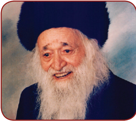
רק הבורא יחליט! רבי בירך זצ"ל

מחוץ לחדר נשמעים קולות החיילים הרשעים המתבדחים בינם לבין עצמם, ולפתע נפתחת הדלת