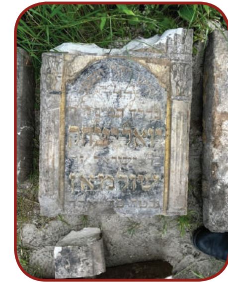
שומטו לריצוף חצר הגסטאפו. אחת מתוך עשרות המצבות שהתגלו