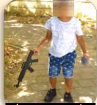
הילד עם הרובה באלעד

הסיפור הזה הרעיד את הלב. ילד בן 6 היה עֵד למחזה המחריד שבו נרצח אביו היי"ד. בימי הישבעה' ביקש הילד שְׁיִקְנוּ לו רובה, ולאחר שהביאו לו רובה-דְּמָה, לחשה אימו הצדקנית באוזניו גחלי-אמונה שניתזו למרחוק, ואמרה: 'דע לך בני, שכל רובה הוא דְּמָה, וההגנה היחידה היא רק על-ידי התורה הקדושה'. וגם: הרב ציולק מגלה לילד סוד שגילה לו מרן הגרא"מ שך בשם החפץ חיים