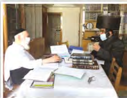
המרא דאתרא ובעל המתיקות בסוד שיח בעיצומו של חג המצות

המרא דאתרא: מורי וחמי הגר"י ש'אלישיב זצוק"ל לא הסכים שיברכו עליו 'שחלק מחכמתו ליראיו', ושאלו אותו מדוע, הרי זה אמת, אמר: בשלמא כשמברכים על חכמי אומות העולם 'שנתן מחכמתו לבשר ודם', זה אמת, כי הם באמת בשר ודם, אבל מי יכול להעיד על עצמו שהוא