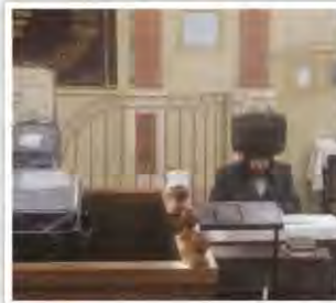
בעל המתיקות הוגה בתורה במקום אשר שם ישב וסיים מסכתות רבות בשנות מגוריו בבני ברק

לאחר מכן התקיימה שמחת ברית מילה בהשתתפות המרא דאתרא, ובהזדמנות זו ביקר 'בעל המתיקות' בבית מדרשנו ועסק בתורה באותו ספסל שעליו היה הוגה רבות בתורה לפני כשלושים שנה.