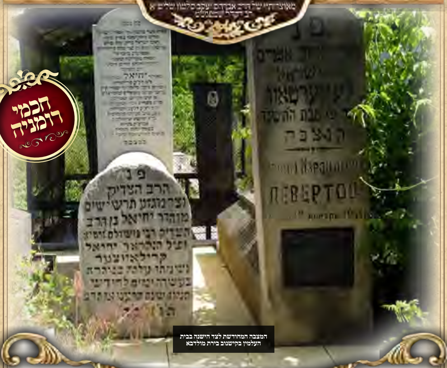
המצבה המחודשת לצד הישנה בבית העלמין בקישנוב בירת מולדובה