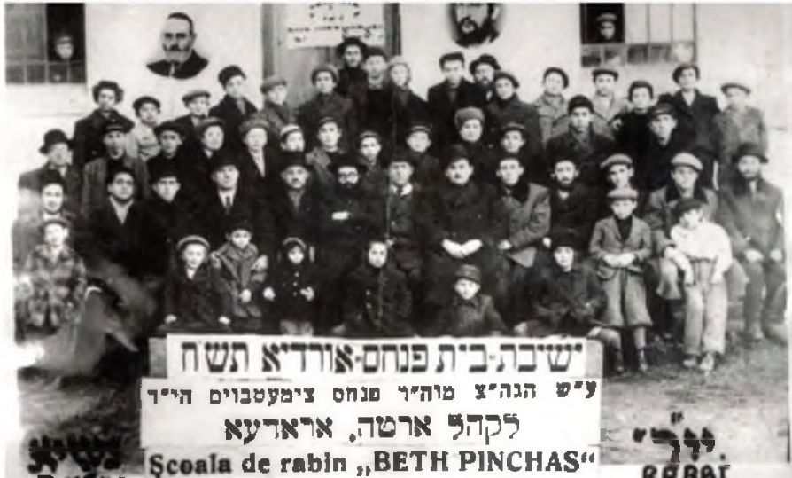
תמונת הישיבה אחרי השואה, רבינו הוא הי"ד

כתולעת, ולעולם אינו ממעט ח"ו בכבודו של בר פלוגתא וכדו', כי אם מבליע בנעימה את השגותיו שלו על דברי חכמים זולתו.