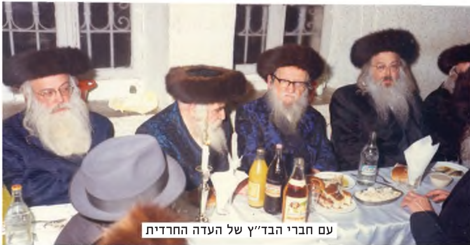
עם חברי הבר"ץ של העדה החרדית

וכך כותב בנו: "בימים ההם הקשים וכלענה מרים, השוד והשבר בבית ישראל שספדו מרורים על אבדן קרוביהם היקרים, נשאו נשים עגונות שאבדו את בעליהן, ואלו מישראל שנותרו בחיים בלא נשותיהן, ורצו להתחתן עם אחיותיהן, או עם נשים אחרות לבנות את קניניהן. בימים טרופים אלה, עמדו גדולי ישראל פליטי הגולה בראותם עני עמם כי גדלה, ופנו אל אאמו"ר שהיה צעיר מהם בהרבה אך נודע לתהילה, ובידעם רב כוחו וחילו רב המעלה, דפקו על פתחו בבקשתם, לך בכחך זה והושעת אותם, ועם היותו נדכה ושובו, אזר חלציו כגבור, ומבלי שהיו עמו ספרי הפוסקים, כי עדיין היה בבוקרשט במרחקים, בכח זכרונו ובסיעתא דשמיא בעזר אלקי הרוחות, העלה על הכתב בעט סופר מהיר תשובות ארוכות. צלל במים