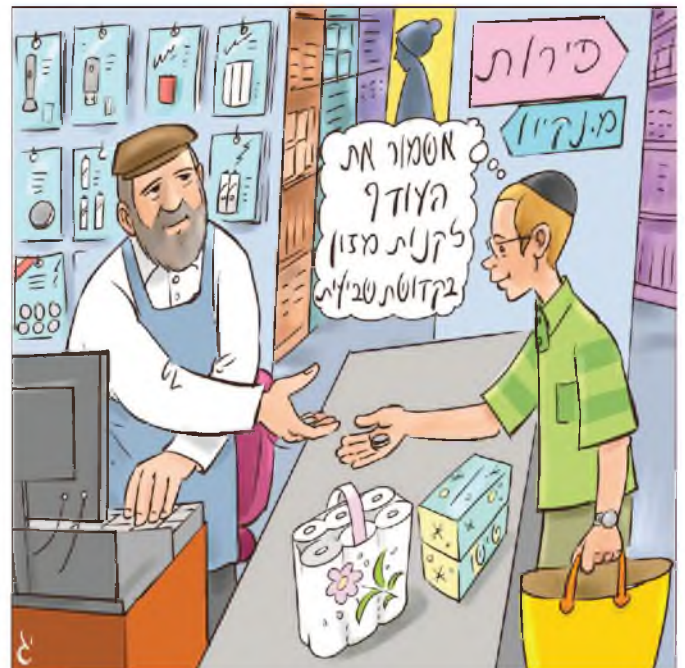
האיור מתוך ספר 'דרך השמיטה'

וכמבואר בברייתא "כיצד, לקח בפירות שביעית בשר, אלו ואלו מתבערים בשביעית. לקח בבשר דגים, יצא בשר ונכנסו דגים. לקח בדגים יין, יצאו דגים ונכנס יין. לקח ביין שמן, יצא יין ונכנס שמן. הא כיצד, אחרון אחרון נתפס בשביעית ופרי עצמו אסור."