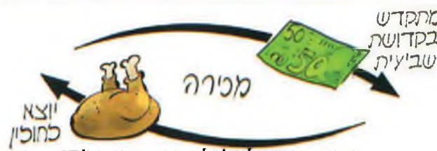
האיור מתוך גיליון 'כל מקדש שביעית' 17