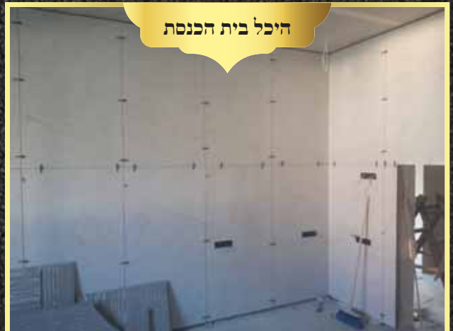
היכל בית הכנסת