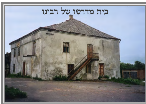
בית מדרשו של רבינו

מרן רבינו זי"ע חוץ ממה שלא מש מאהלו של אביו הסתופף עוד בצל צדיקי הדור, רבינו נסע אצל דודו הגה"ק רבי משה מסאמבור זי"ע בעל ה'יתפלה למשה' ובנו הגה"ק רבי יהודה צבי מראזדיל זי"ע בעל ה'ידעת קדושים'. וכן נסע אצל בן דודו הגה"ק רבי יצחק אייזיק מזידיטשוב זי"ע, אשר חיבבו