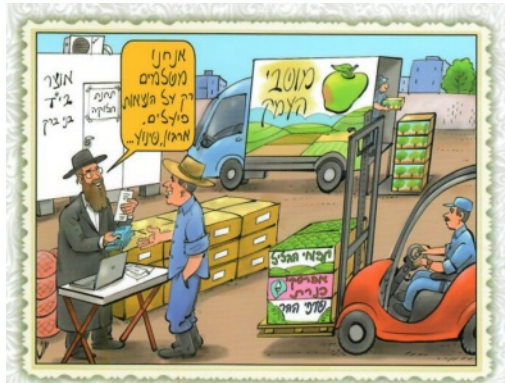
האיור מתוך גיליון 'כל מקדש שביעית' מספר 15

מקור התקנה: מבואר בתוספתא (שביעית פרק ח הלכה א-ב), בראשונה היו שלוחי בית דין יושבין על פתחי עיירות כל מי שמביא פירות בתוך ידו נוטלין אותן ממנו, ונותן לו מהן מזון שלש סעודות, והשאר מכניסין אותו לאוצר שבעיר. הגיע זמן תאנים שלוחי בית דין שוכרין פועלין עוודין אותן ועושין אותן דבילה, וכונסין אותן בחביות ומכניסין אותן לאוצר שבעיר. הגיע זמן ענבים שלוחי בית דין שוכרין פועלין בוצרין אותן ודורכין אותן בגת, וכונסין אותן בחביות ומכניסין אותן לאוצר שבעיר. הגיע זמן זיתים שלוחי בית דין שוכרין פועלין ומוסקין אותן, ועוטנין אותן בית הבד וכונסין אותן בחביות, ומכניסין אותן לאוצר שבעיר ומחלקין מהן ערבי שבתות כל אחד ואחד לפי ביתו.