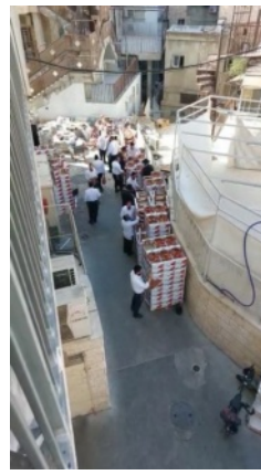
שיבת מיר ירושלים כ"ה אייר תשס"ב חלוקת פירות שביעית חנים מטעם אוצר בית דין בני ברק, באמצעות 'קרן משנת יוסף', לאחר תרומה שהתקבלה ליכסי הווצאות.

וכתב בחוט שני (שביעית עמוד שפ) טעמים נוספים לאוצר בית דין: ד. לקיים את רצון התורה המבואר בפסוק (ויקרא פרק כה פסוק ו) והיתה שפת הארץ לְקַטְלָהּ , שמחלקים לכולם בערב שבת, ואוכלים פירות שביעית בקדושה, ומתקיים בזה רצון התורה 'לכם אלאכה', ולולי כך הרחוקים מהשדות והכרמים לא יטרוח לבוא עד השדות בכדי ליטול פירות.