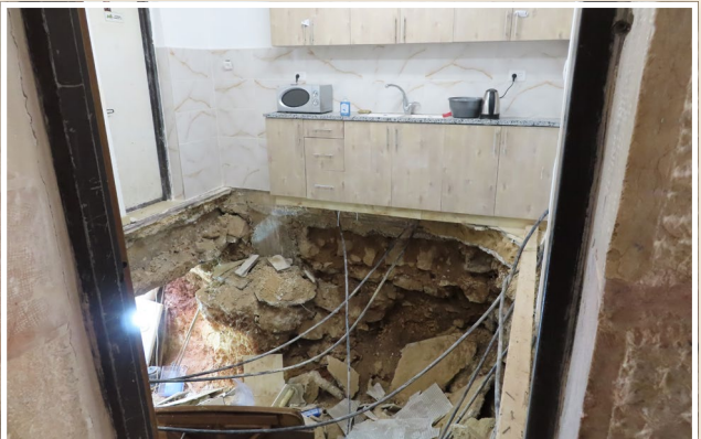
בתמונה: הריסה במטבח. מימין ניכר הקרש שעליו צעד בעל המעשה כדי להציל נפש מישראל.

התשובות מונחות בתוכן גליון זה. ניתן לשלוח את התשובות לכתובת האי-מייל: 7885595@gmail.com או בהודעה קולית בקו 'קול מתיקות': 073-313-4395. בצירוף שם כתובת וטלפון. | הזוכה מפרשת בהר: משפחת רייזמן, בית שמש.