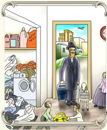
להכניס דעת ה' בבני הבית, לשנון עם כלם שהגשמיית שיש לנו בבית כל כלה רוחנית...

כמו שמספר על הגאון רבי שלמה זלמן אויערבאך זצוק"ל, שטרם שהוא נכנס לביתו, הוא עמד וסדר את חליפתו, שאלוהו תלמידיו - דרך העולם להסתדר לפני שהם יוצאים מביתם, ולא כאשר הם חוזרים לביתם? ענה להם הגרש"י כעת אני הולך לעקר השלמות שלי וזה עקר עבודתי בעולם הזה.