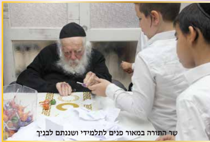
שר התורה במאור פנים לתלמידי ושננתם לבניך

רבי דוד מלעלוב, 'האוהב ישראל' שנודע באהבת ישראל העצומה שלו, היה מסביר זאת באמצעות משל: שני אפרים הסבו במרוח. שאל האחד את חברו: "האם אתה אוהב אותי?" "מאד" - ענה השני. "אם כך תאמר לי בבקשה, מה אני חסר ונדרג?" - שאל הראשון. "מנין לי לדעת?" - השיב השני בשאלה.