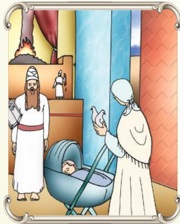
היולדת מביאה תורים או בני יונה, היונה מסמלת לנאמנות...

וכאשר אדם יתבונן בכל הטוב, שיש לו, הוא לא יקנא בזולתו, וצריך להשריש את זה בבית, לא לדבר שלילי, על שום קהלה ועל שום שכונה ועל שום עיר חלילה, לראות את הכל טוב לדבר על כלם טוב, והילדים לומדים ומתנהגים כמו שהם שומעים בבית, ולפעמים אם נותנים בקרת ורואים רע בחלק מכלל ישראל חלילה, זה נכנס לילדים, וקשה להוציא זאת, כי הם מקבלים על עדה זו או על אנשי מקום מסים, תוית של חסרון כל שהוא, ולפיכך צריך לעסק בחסה וזה ירעיף על הילדים עין טובה.