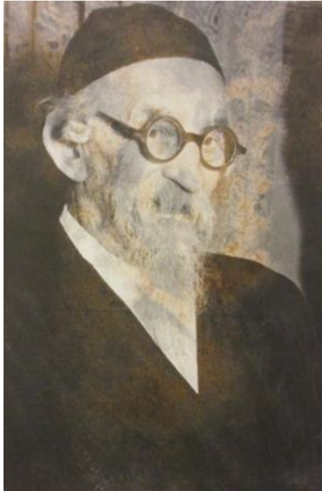
שמכמה עינים שהובאו לפניו להתייעץ אתו מוכח שהוא "בעל רוח הקודש".