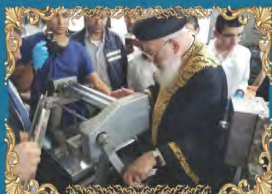
הראשון לציון ורבה של ירושלים רבינו שלמה עמאר שליט"א