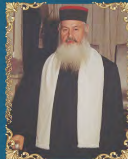
הרב שלום משאש י' ניסן תשס"ג (2003) פוסק הלכות מגדולי רבני עולי מרוקו. היה רבה הראשי של מרוקו ורבה הראשי הספרדי של ירושלים.