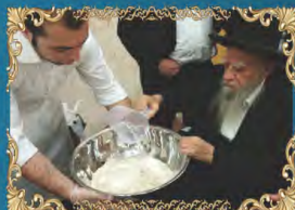
הראשון לציון רבינו אליהו בקשי דורון זצ"ל