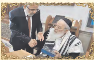
הראשון לציון ורבה של ירושלים רבינו שלמה עמאר שליט"א

זכינו ובמכון להוצאת ספרים וחקר כתבי יד "תפארת רפאל" של מוסדותנו, הוצאנו לאור ספר חמשת חומשי התורה בכרך אחד מהודר ומפואר, בצירוף ההפטרות לפי כל המנהגים, כולל התפילות ליום השבת בנוסח עדות המזרח ומרן רבינו עובדיה יוסף זצוק"ל . סדר אותיות חדש ומדויק, באותיות מאירות עיניים. מודפס על נייר בייבל כרומו, כריכה חדשנית ומפוארת. פירוש רש"י ותרגום אונקלוס בניקוד מלא, ועוד פירושי חז"ל על התורה. אף פתחנו ראשי תיבות וציינו מראי מקומות. החומש מעוטור בהמצות הראשונים לציון שליט"א, בצירוף קונטרס "ילקוט יוסף" דיני ספר תורה' השלם.