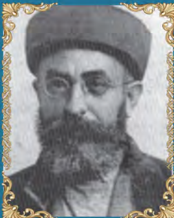
הרב מסעוד חי בן שמעון כ' ניסן תרפ"ה (1925) היה אב בית דין ורבה הראשי של מצרים. תרגם את השולחן ערוך לערבית ספרותית.