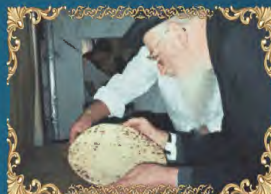
הראשון לציון רבינו מרדכי אליהו זצ"ל