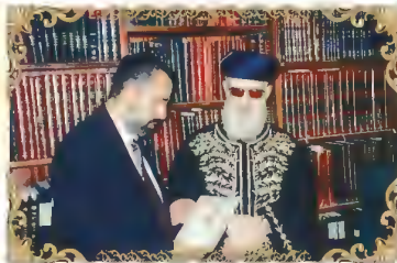
הראשון לציון מרן רבינו עובדיה יוסף זצ"ל עם מייסד העלון הרב שלמה זביחי שליט"א המגיש לפניו את עלון מספר 500