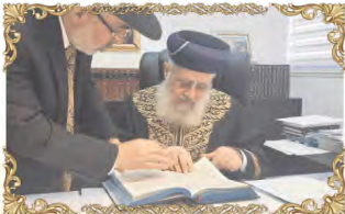
הראשון לציון והרה"ר לישראל רבינו יצחק יוסף שליט"א