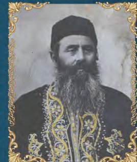
הרב שלמה מוסיוף ה' ניסן תרפ"ב (1922) היה נגיד, חכם ומקובל. מרבני עולי בוכארה ומייסדי שכונת 'הבוכרים' ושכונת 'כרם שלמה' בירושלים.