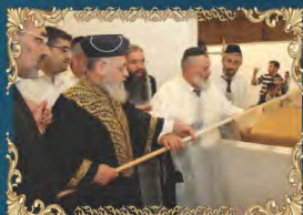
הראשון לציון והרב הראשי לישראל רבינו יצחק יוסף שליט"א