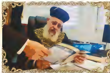
הראשון לציון רבינו יצחק יוסף שליט"א נותן את עצתו הדרכתו וברכתו לרגל הוצאת עלון מספר 1,800

היוצא לאור משנת תשמ"ה (1985) מידי שבוע בעשרות אלפי עותקים ומחולק בכל רחבי הארץ ולקהילות בחו"ל. גדולי ישראל סמכו ידיהם על עלון זה שמפיץ את תורת רבני ספרד והמזרח ומנחיל את מורשת יהדות ספרד המפוארה יחד עם הלכות וזמנים ממתן רבינו עובדיה יוסף זצוק"ל