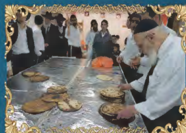
נשיא מועצת חכמי התורה רבינו שלום כהן שליט"א