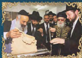
הראשון לציון מרן רבינו עובדיה יוסף זצ"ל