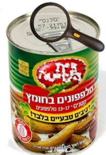
יבול נכרי בהשגחת הבד"ץ ים ללא הסדר שליחות [התמונה המחשה בלבד]

אלא שמצוי הדבר שהכסף מתקדש ברכישת מוצרים מיבול נכרי המשווקים דרך מפעל או חברה שבהשגחת הבד"ץ ירושלים, שמאחר ולמנהג ירושלים אין קדושה ביבול נכרי ואין בו איסור סחורה, לא סידרו ברכישתם מהנכרי הסדר 'שליחות', כך שהתשלום שנותן עבורם הצרכן ניתן כתמורה לפירות, וחל בו קדושת שביעית. ומצוי הדבר בסלטים טריים או קופסאות שימורים של המוצים מיבול נכרי 3 . נולא מועיל מה שיש הסדר 'שליחות' בחנות, שכן יבול זה כבר נרכש מהנכרי ע"י המפעל בלא שליחות. וכמו כן מטעם זה מתקדש הכסף [לנוהגים קדושה ביבול נכרי] בכל החנויות בירושלים המוכרות פירות וירקות מיבול נכרי, מאחר שאין בהם הסדר שליחות.