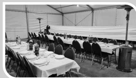
חדר האוכל המרכזי בקרעסטיר

וכך כל יום שערב קבלנו עוד ועוד פניות בעיקר של יהודים שמחפשים אוכל כשר, וכך מצאנו את עצמינו מכינים יום יום עשרות מנות של מאכלים כשרים לכל מי שרק חיפש אוכל כשר, וכמובן שבפולין לא קלה הדרך להשיג מאכלים כשרים, בעיקר בשר ועופות, ונאלצנו למרות הכמויות שאנו דואגים לשריין לימין עמוסים כמו כ"א אדר, להשיג מיד עוד כמויות גדולות של בשר ועופות, ורכשנו מיד עוד בשר מהשחיטה של העדה החרדית בפולין, והיות והעדה החרדית לא שוחטים עופות בפולין, ומשמים קא מסבבי והגיע השמועה לאזינינו שקיימת שחיטה של עופות בפולין שמאורגן ע"י אנ"ש הגרים במאנטססטר, וכל הצוות השוחטים הבודקים והרבנים הינם יהודים יראי שמים מחשובי אנ"ש מירושלים שעובדים בד"כ בשחיטות המהודרות שציבור אנ"ש נוהגים לאכול, והפצרו בהם למכור לנו כמה טונות של עופות, ואכן הדבר יצא לפועל ורכשנו מיד 4 משטחים של עופות, וכך היה לנו את האפשרות לזכות את ישראל במאכלים כשרים ומהודרים.