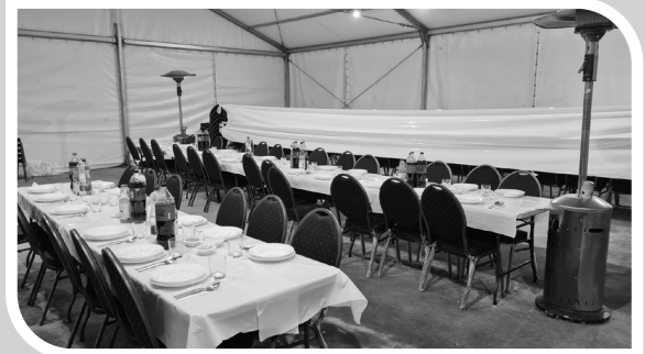
חדר האוכל המרכזי בקרעסטיר