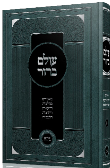
רכישת ספרי הרב: ספרי אברמוביץ משלוח ברחבי העולם 03.578.2270

בחלקו האחרון של הספר מופיעים "מאמרי התקופה" - שיעורים שנמסרו לאור תקופתנו, וכן מאמר נוגע לתקופתנו מאת הגה"צ רבי שמשון דוד פינקוס זצ"ל, היוצא לאור לראשונה.