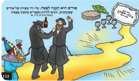
פורים הוא הכנה לפסח. על-ידי מצוות של פורים שפוקמים, זוכים להיות נשקרים פחמין פסחא: (דברי חיים סי' ע"ב)

השם יתברך זאל זיך שוין מרחם זיין אויף כלל ישראל ובפרט אויף די אידן אין אוקריינע, עס