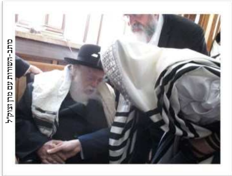
מתוך-תשורות עם מרן זצוק"ל