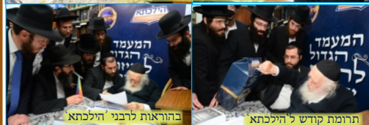
בהוראות רבני הילכתא