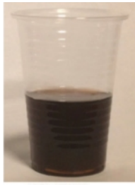
מידת 75 סמ"ק

ר' חיים נאה מדד את הדרהם הטורקי שהיה בימיו בארץ ישראל, במשקל 3.2 גרם, וכאשר חישוב עשרים ושבע דרהם שהוא המשקל של רביעיית מים לפי השיעור שכתב הרמב"ם, יוצא 86.4 סמ"ק, ולפי החשבון הזה יוצא שהרמב"ם מדד את הנפח המקובל של שיעור רביעיית, בסך הכל 10.8 אצבעות מעוקבות (10.8=2.7*2*2), נמצא לפי שיעורי זמננו שהאצבע שהרמב"ם מדד בה היתה בת 2 ס"מ.