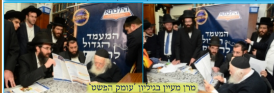
מרן מעין בגיליון 'עומק הפשט'

תמונות מהביקור ההיסטורי של רבני 'הילכתא' בבית מרן שר התורה הגר"ח קניבסקי זצוק"ל חורף תש"פ