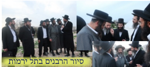
סיור הרבנים בתל ירמות