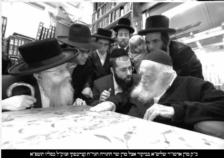
כ"ק מרן ארמ"ר שליט"א בביקור אצל מרן שר התורה הגר"ח קנייבסקי וצוק"ל בסלוי תשפ"א

רבינו אף עורר פעם שחשוב ללמוד בספרו דרך אמונה, רבינו דיבר שצריך באופן יסודי ללמוד משניות ורע"ב, ולהתחיל מסדר זרעים, והיות שזרעים הוא לימוד קשה, ע"כ הקב"ה שתל בדורנו את ר' חיים קנייבסקי שהוא ת"ח וצדיק, וחיבורו על סדר זרעים הוא הטוב ביותר כדי להבין הדברים באופן יסודי ומקיף.