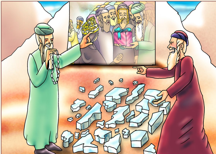
הַקְּסֵבֵר הַמֵּלֵא לְצִיּוּרִים וְהַתְּשׁוּבוֹת לְשֵׁאוֹת, בְּמֵאֲמָרוֹ: 'מִתִּיקוֹת שְׁלוֹם הַבַּיִת שֶׁל מִשָּׁה'.

בְּצִיּוּר שְׁכֻכוֹתֵת הַגְּלִיוֹ: הַמּוֹשֶׁק מְתוֹנָס בְּמִדְבָּר בְּמִרְכָּה חֲנִית עִם יִשְׂרָאֵל קִשְׁרָה עָלָיו.