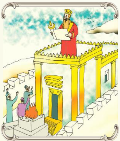
בזמן שיש מלחמות ה' רוצה שנדבר ממנו, ונבקש שיגאל אותנו גאולה כללית וגאולה פרטית...

ה' מתפנה כביכול מהכל, כאשר אנו באים לדבר עמו. וה' קורא לנו: 'יעקנקל'ה בני, חיימק'ה בני - ברכני! אני רוצה שתברך אותי על כל הטוב שאני נותן לך!'