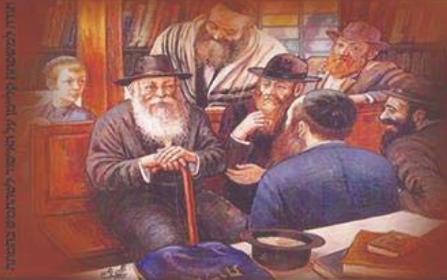
תורה למשפחה ליישן על האישור לפרויקט המבית