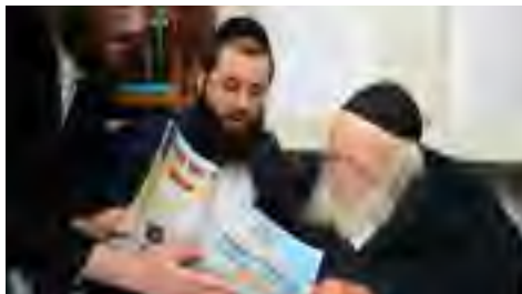
מעיין בגליון באר בשדה