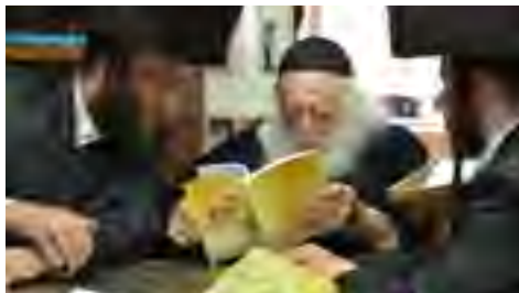
מעיין בקובץ עלי זבח עניני נישואין בהוצאת מכונינו