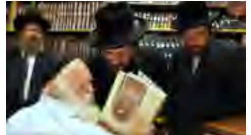
מעיין בקובץ תורת אמת בהוצאת מכונינו