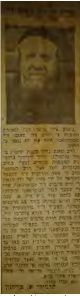
ידיעה על פטירתו בעיתון למלאת שנה לפטירתו