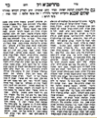
עותק נדיר, מסדר הנהגות הרשב"א פראהבישט, שנדפס בשנת תר"א בטרטוביץ