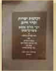
הנהגות ישירות וסדר היום פראהבישט שנדפס מחדש בברוקלין שנת תשנ"א

הנהגות ישירות וסדר היום לרבי שלום לפי סדר נכון וחדש עם תוספת ציונים הערות וביאורים והרחבות מספרית למידי הנעש"ט הקדוש וצאצאי בית רוזי"ן כפי שנערכו על ידי מכון 'שכינת שלום' ללימוד ולפרסום תורת וסגולת הרה"ק הרבי ר' שלום מפראהבישט זיע"א