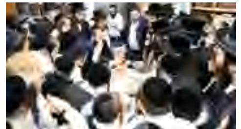
ילדי הת"ת שטפנשט באלעד מתברכים במעונו בחג החנוכה האחרון התשפ"ב