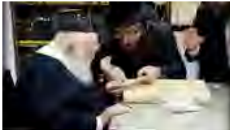
מעיין ומברך את הקלפים של המזוזות שיוענקו כסגולה לשמירה לתומכי המוסדות