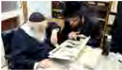
מעיין בתכניות בניית המקוה בעיר יאס שנבנה בבית ההכנסת אורחים ושטפנשט ברומניה ובמתן הערותיו ההלכתיות לדעת החזון איש אותם ביקש שניישם בבניית המקוה