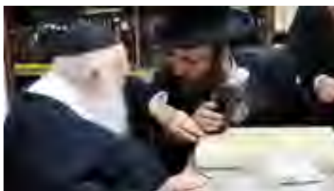
בהענקת יין הסיימים לחלוקה לתומכי המוסדות