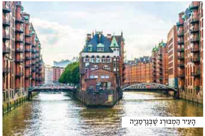
העיר המבורג שבגרמניה

למלוא האפק נשקפה העיר המבורג במלוא הדרה. בצריחיה ובגנייה הנאים יצרה היא תמונת נוף משלמת, ובנהר הרוגע שארם תחתיה שיטו סירות תירים קטנות שהוסיפו נפך לתמונה השלוה והבראשיתית.