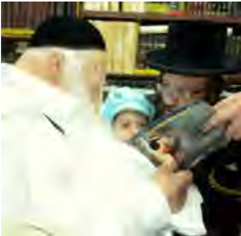
מעיין בעלי זבח - חלקה בהוצאת מכונינו