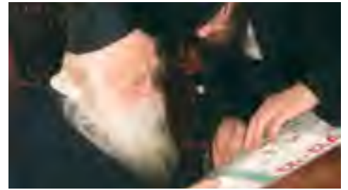
בהצגת המפה של העיר בני ברק בה הצבענו על רחובות שונים בהם שקלנו להקים את בנין מוסדות שטפנשט והמלצתו-ברכתו 'זכרון מאיר'