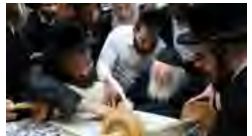
בכתיבת אות בספר התורה שהוכנס לבית מדרשינו