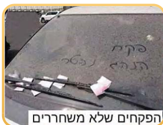
פקחים שלא משחררים