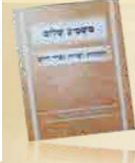
הנהגות פראהבישט מהדורת סבון קדושה ומלכות' שיע' איגוד החברות 'דרכי שמואל' מיסודו של מרן הג"צ מוהר"ש טוביאס זצוק"ל. תשע"ט