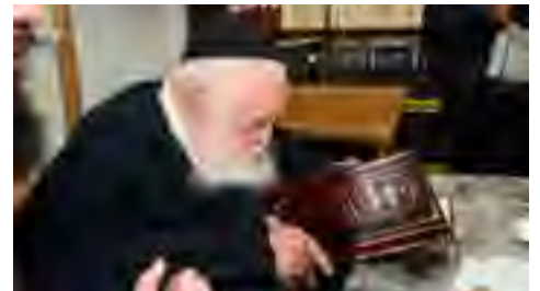
מעיין בספר סגולת מלכים בהוצאת מכונינו