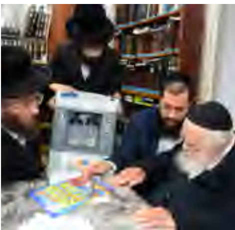
בודק את מכשיר מחולל החמצן שנרכשו על ידי ארגון 'רפואה לישראל' זרוע הרפואה של מוסדות שטפנשט להצלת חיים בתקופת הקורונה