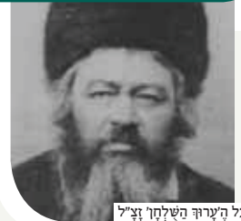
בעל הערוך השלחן זצ"ל

הגאון רבי יחיאל מיכל אפשטיין נולד בעיר בוברויסק שבבלארוס בשבט תקפ"ט. כבר מצעירותו הרגיל עצמו ללמד בצורה שיטתית ומסכמת, ובדרך זו חבר את ספרו ההלכתי המקיף והמפורסם 'ערוך השלחן'. ספר זה נכתב לפי מתכנת ה'שלחן ערוך', באותה חלקה לסימנים אך בהרחבה רבה, ובתוספת הדעות השונות שהתחדשו עד ימיו. בנוסף לספרו זה חבר גם את 'ערוך השלחן העתידי' שבו יחד את הדבר על ההלכות שאינן נוהגות בזמן הזה.