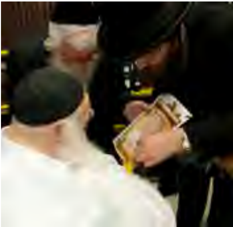
בחתמת כתב השליחות לתפילה בציון הרה"ק אדמו"ר הראשון משטפנשט לטובת ולתמיכת אברכי הכוללים