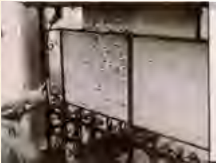
מצבת זוגתו מרת נחמה (מצאצאי משפחת שור) בבוטושאן