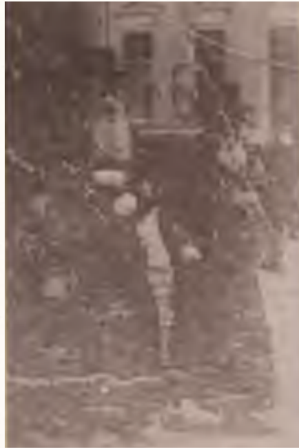
תמונה נדירה מה'פחד יצחק' מהלך מחוץ להויף בבאיאן

ביום ג' לסדר חיי שרה, ח"י חשוון תרמ"ז, עזב רבינו את נחלת אבותיו הקדושים בסאדיגורא, והתיישב בבאיאן.