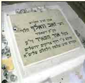
המחצבה על ציון קברו של 'אור המאיר'