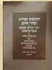
הַתְּהוֹמָת יִשְׂרָאֵל וְסִדְרֵי הַיּוֹם מִפְּרָאֵה־בִישֵׁט שְׁנַדְפֵס מְחֻדָּשׁ בְּבוֹרוֹקְלִין שַׁנַּת תְּשנ"א

ללימוד ולפרסום תורת וסגולת הרה"ק הרבי ר' שלום מפראהבישט זיע"א