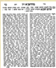
עוֹתָק נִדְרוֹ, מִסְדֵּר הַתְּהוֹמָת הַרְשֵׁב"א פְּרָאֵה־בִישֵׁט, שְׁנַדְפֵס בְּשַׁנַּת ה'ת"א בְּטַשְׁרֵנוּבִיץ