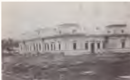
חצר הקודש בבאיאן

ביום הפורעים, שלוש ימים לפני הסתלקותו, פוּד ערך רבינו את השולחן הטהור, וסיים את אמרי קודש פוסק: "אשרי העם שככה לו", ובעמודו לפני פתח חדרו אמר: "א גוטע נאכט, לישועתך קויתי ה'". נכדו הרה"ק רבי משה'ניו מבאיאן-קראקא, ביאר את דברי קדשו ורמזותיו האחרונות לפני הסתלקותו, באומרו כי איתא ב"נר ישראל" מרה"ק המגיד מקאזניץ בשם הבעש"ט ז"ע, כי ככה"ר ר"ת כתר כל הכתרים, והוא סימן לגאולתן של ישראל. ובגמרא יומא איתא, כל ככה עיכובא, שהוא לעכב את הפורעניות. ע"כ כשראה משה רבינו ע"ה שישאר שוארו במדבר, אמר פרשת נסכים, שאיתא שם הרבה פעמים ככה לעיכובא. ועוד איתא בזה"ש שצדיק לפני פטירתו מרמז בו הפסוק שמוכרח ללכת מזה העולם, מפני שכ"ה גימטריא מש"ה, בחינת הצדיק והדעת של כלל ישראל. ופירוש אשרי העם שככה - כל זמן שככה, היינו הצדיק הוא עוד לו.