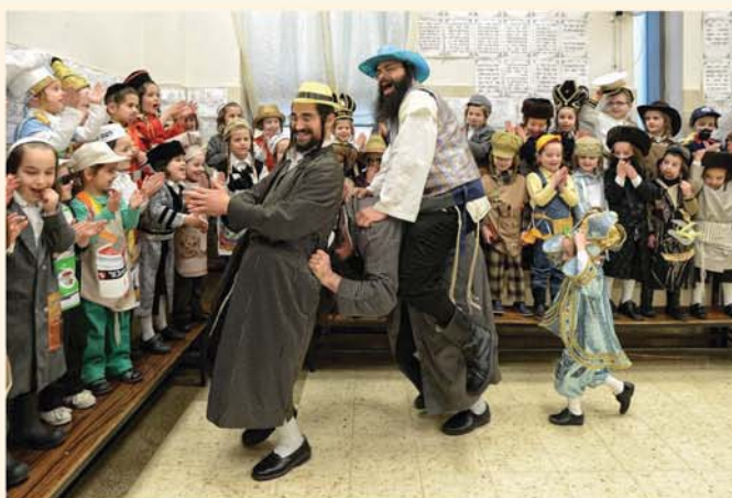
שמחת פורים בתלמוד תורה "תולדות אהרן"

נדמה לי כי אי פעם שמעתי, "סליחה, האם לא ראית... כמדומני ש...". - אני ממלמל בקושי ומבטי נתקל בדמותו, אני מוסיף להסתכל על חזונו ההולך ומחוויר מרגע לרגע. הוא מחליק באטיות את ידו מתוך ידי ונשאר עומד נבוך. שנינו עומדים ומסתכלים אחד על השני כשהדיבור ניטל מפינו. תוך כדי עמידה הוא מפנה את ראשו כאילו לא שמע כלל את מלמולי, וחוזר באטיות לחדר הסמוך.