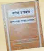
הַתְּהוֹמָת פְּרָאֵה־בִישֵׁט מִהַדוֹרֹת מִכּוֹן 'קִדוּשָׁה וּמְלֻכּוֹת' שֵׁע"י אִיגוֹד הַתְּבוּרֹת 'דְּרִכֵי שְׁמוּאֵל' מִיִּסְדוֹר שֶׁל מִנּוֹן הַהַר"צ מוֹהֲרֵ"שׁ טוֹבִיאָם וְצוֹק"ל, תְּש"ע"ט