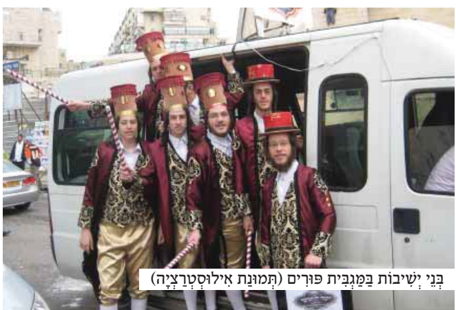
בני ישיבות במגבית פורים (תמונת אילוסטרציה)