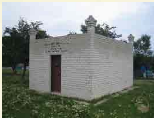
האהל שחודש על ציון קברו של הרה"ק 'אור המאיר' בעיר איבניץ הסמוכה לזיטומיר

כאמור, בדבריהם ציינו את תאריך הסתלקותו של רבינו בערב חג השבועות, אך ב'שאירת לשאירת' הנספח לספר 'שם ושארית' מובא שתאריך פטירתו הוא בפורים תקנ"ח. אף לגבי השנה שבה נסתלק רבינו רבים כתבו בפשיטות שהסתלק בשנת תק"ס, אך גירסא זו ודאי איננה נכונה כיון שהרי ספרו של רבינו 'אור המאיר' נדפס בשנת תקנ"ח וכמו שנכתב בשער הספר לסדר ופרט 'זוהיה מנוחתו כבוד' ובכל ההסכמות נראה ברור כי רבינו כבר לא היה אז.