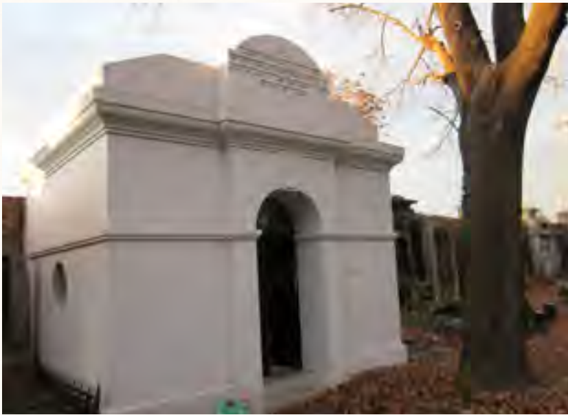
אוהל הציון ביבנה

החסידים בבאיאן התבטאו, כי כל זמן שהותם בחצר הקודש היו מרגישים טעם גן עדן, מעין עולם הבא, והכל היה טוב וערב עד מאוה, מלבד בשתי עיתים: הראשון, בעת שהיו אמורים להיכנס להיכל קדשו של הרבי "זיך פראוען" [הכניסה ביחידות אל הרבי והגשת הקוויטל' נקראת כפי חסידי אנ"ש 'פראוען'], שהיו חשים אז כפחד ובמורא גדול עד מאד. והשני, הג'עזענגען - הפרידה - בעת שנאלצו