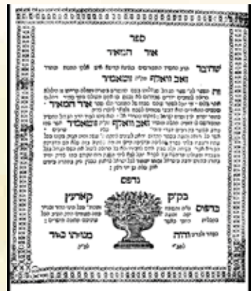
שער ספרו אור המאיר שנדפס בקארעץ תקנ"ח

מגדולי חבורת תלמידי מרן המגיד הגדול ממעזריטש זי"ע, היה מרן רבינו הרה"ק רבי זאב וואלף הלוי זי"ע, מגיד מישרים דק"ק זיטאמיר. מבית מדרשו האירו אלומות של אור מתורת רבותיו הקדושים אשר מנארותיהם דלה ומהם השקה את אלפי בני ישראל ממעזריטש זי"ע, הרה"ק בעל 'תולדות יעקב יוסף זי"ע, הרה"ק רבי פנחס מקארעץ זי"ע, הרה"ק רבי נחמן מקאסוב והרה"ק רבי יחיאל מיכל מזלאטשוב זי"ע.