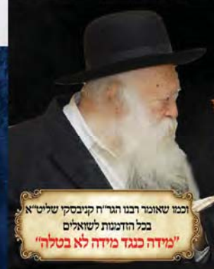
וכמו שאומר רבנו הגדול קניבסקי שליט"א בכל הדומעות לשואלים "מידה כנגד מידה לא בטלה"