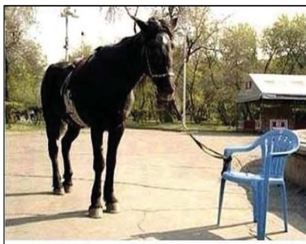
לפעמים הדברים שמונעים מאיתנו להיות חופשיים הם יותר פסיכולוגים מאשר אמיתיים.

על ידי גזל או שמביש פני חברו, אין תפילתו נשמעת