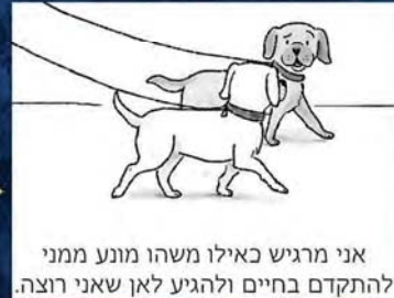
אני מרגיש כאילו משהו מונע ממני להתקדם בחיים ולהגיע לאן שאני רוצה.

החוקרים הטובים ביותר: 1% שבכ 1% המוסד 98% אבא שלי כשהוא מחפש מאיפה נכנס הקור לבית