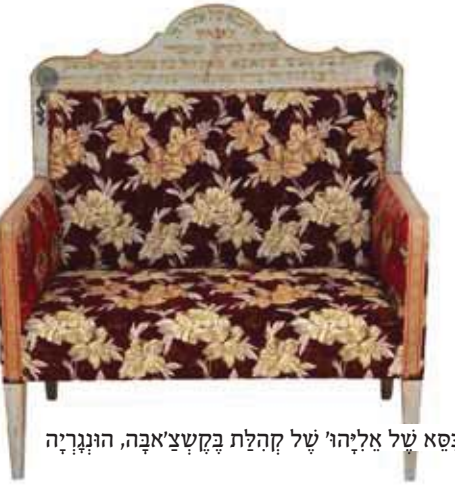
פסא טל אליהו של קהלת בקשצ'אבה, הונגריה

המום ומבלבל נכנס הרב אבובב לחדרו של התינוק. הוא פרש את כלי המילה על שדת ההחתלה המהדרת, וכשהביט בתינוק הישן בשלוה על מטתו, הוצפו עיניו בדמעות. בחלומותיו הפרועים ביותר, לא חלם שאי פעם יערוך ברית שכזו.