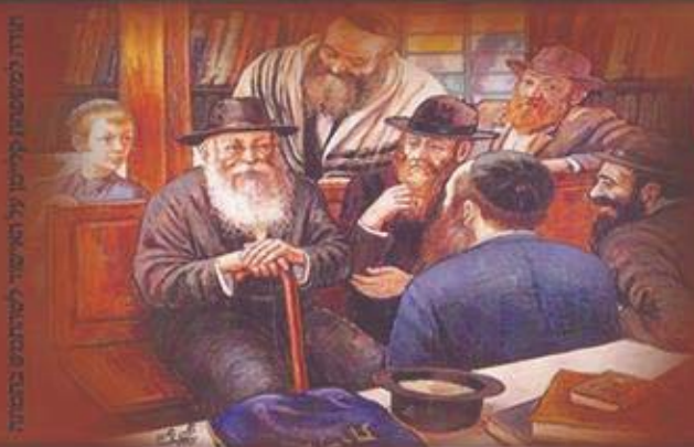
תורה למשפחה קייטן על הסיפור לפרשת במדבר