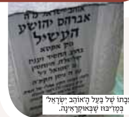
מצבתו של בעל האוהב ישראל' בסוף ימיו שבאוקראינה.

בסוף ימיו עבר למז'יבז, ושם, ביום ה' בניסן תקפ"ה עלתה נשמתו בסערה השמימה, ונטמן סמוך לציון ה'בעל שם טוב'. על מצבת קדשו נחרת: "פ"נ הרב אדמו"ר אוהב ישראל מ' שמואל ז"ל. נפ' ה' ניסן תקפ"ה. לעת זקנותו תקע אהלו של שלשלת היוחסין מ' שמואל ז"ל. נפ' ה' ניסן תקפ"ה. לעת זקנותו תקע אהלו של תורה פ"ק מעזבדו ולו דומי' תהלה ובמקום גדלתו שם ענותנותו, אשר יצוה את בניו שלא לכתב על מצבתו שבחות. תנצב"ה".