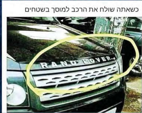
כשאתה שולח את הרכב למוסך בשטחים

לע"נ הילד הנעים אליהו שור בן חנה ז"ל שהיה מקוראי העלון ומשתתף בפעילויות