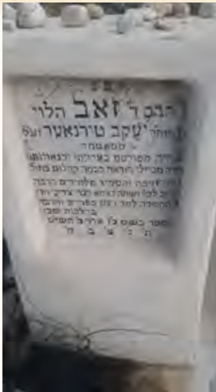
תמונת המצבה מקרוב

עם התיישבותו בשאץ מלאו ידיו בעבודה רבה, להקים הדת על תילה, רבינו פעל גדולות ונצורות בהרבה תחומים. אל העיר שאץ נתגלגלו בימים ההם המוני פליטים מחרב המלחמה, שכולים וגלמודים אנדרלמוסיא גדולה שררה בכל שטחי החיים הגשמיים בכלל והרוחניים בפרט והעזובה בשטח הדת היתה רבה. אזר איפה רבינו חלציו כגבר והתחיל לכוון בעיר חיי תורה חדשים והתאמץ לקבוע בה סדרי קהילה מתוקנת. כך דאג לארגן סדרי כשרות ראויים, העמיד חופות וסידר קידושין, והצליח אפילו להרביץ בה תורה למעט צעירים שהיו מוכנים לכך,