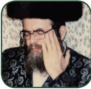
'ריבוננו של עולם, אני רוצה להינצל!' הרב שייק בצעירותו

(מתוך ראיון עם הרב צ"ל, התפרסם במגזין 'ניצוצות' אדר תשע"ה)