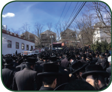
כל דקה. הלווייתו של הרבי במונסי

הבן, שמפתח הבית היה תדיר בכיסו עקב שימושו את אביו, נקש תחילה בדלת מפני הכבוד. הרבי ישב. הרבי המהם בקולו כמאשר את הכניסה, והבן נכנס עם הרב אל הבית.