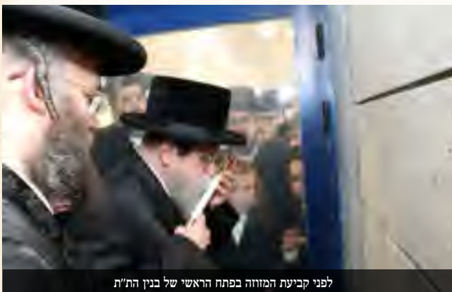
לפני קביעת המזווה בפתח הראשי של בנין הת"ת

הרה"ק אדמו"ר הזקן מטשורטקוב זי"ע ועכ"י אמר אודות מסירות נפשו של משה רבינו שמבואר בפרשתו, ואתה תצוה, שלא נזכר שמו של משה רבינו בפרשה, ובטעם הדבר אמר הרה"ק ר' יצחק מווארקע זי"ע שמישה רבינו קודם הסתלקותו התעלה למדרגה עילאית של התקרבות להשי"ת, באופן שלא היה צריך לקרא לו, והיה די במאמר ואתה, אבל הרה"ק מטשורטקוב אמה מסירות נפשו של משה רבינו רבינו עבור בני ישראל היה