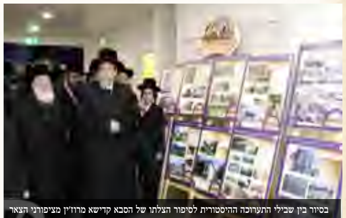
בסיור בין שבילי התערוכה ההיסטורית לסיפור הצלתו של הסבא קדישא מרו"ן מציפורני הצאר