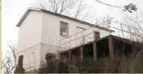
האהל בפראהבישט הנמצא במעלה הדר