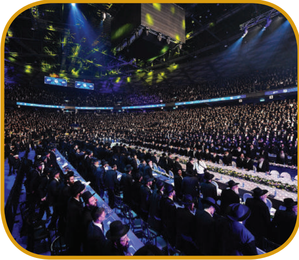
חסידי ברסלב מצטרפים בהמוניהם. מעמד הסיום בהיכל 'ארתה' ביוזשלים

זיע"א: "שרצון רבינו ז"ל היה שילמדו את ארבעת חלקי השו"ע כולם על הסדר דייקא". ועוד מוסיף וכותב: "ועל לימוד הפוסקים הזהיר מאד מאד ביותר מכל הלימודים והוא תיקון גדול מאד מאד".