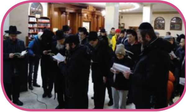
מאמינים בתפילה. תושבי אומן השבוע בתפילה מיוחדת על ציון רבינו הקדוש