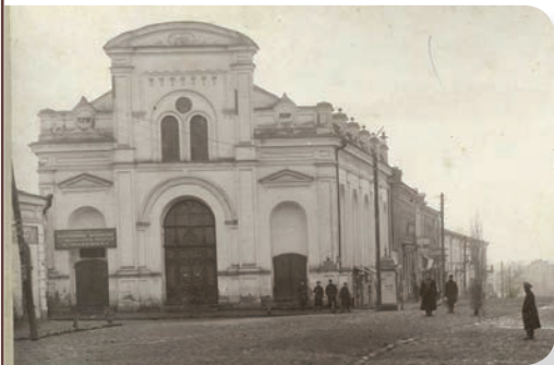
שטאטישע שול אין בארדיטשוב

ר' שמואל העשיל איז נאך עטליכע יאר געגאנגען וואוינען אין שטאט יפו. ווינטער תרע"ד איז ר' שמשון דארט געקומען מיט זיין זון שמחה, ווען