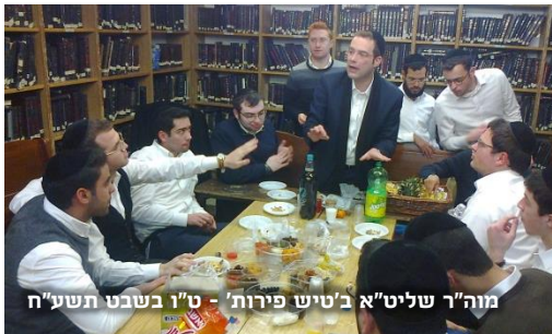
מוה"ר שליט"א ב'טיש פירות' - ט"ו בשבט תשע"ח

מוכר הפירות אמר ליהודי המוסקבאי, שמטבעות אלו הם החסכוניות שחסך לעצמו במשך כל השנים ממכירת הפירות, 'אני שומר על כספי כעל בבת-עיני, ואינני מבזבז אותן. ואתה מוציא בשביל מנהג כל כך הרבה כסף?!