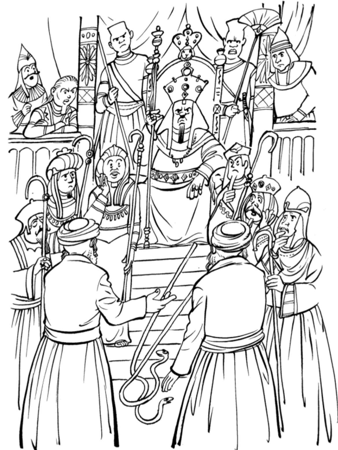
ואחר באו משה ואהרן ויאמרו אל־פרעה כה־אמר ה' אלהי ישראל שלח את־עמי ויחגו לי במדבר:

'שתולים בבית ה' (עמ' 9): הילד שטיפס ושפך את הדיו, הקים את כל קרית סקווירא "אתה עוד תצא משהו גדול עם העקשנות שלך!" הבדאי שהפך לסופר.