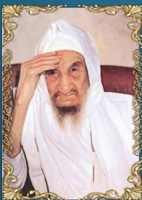
רבי ישראל אבוחצירא ד' שבט ה'תשמ"ד (1984) רבה של מחוז תפילאט, ומגדולי רבני עולי מרוקו. מודע כבעל מופתים ומוכר בכינוי "הבבא סאלי".