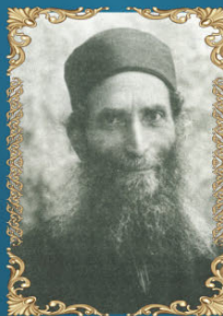
הרב חיים משה אלישור ד' שבט ה'תרפ"ד (1924) היה הראשון לציון וראש הרבנים לעדת הספרדים בירושלים, בנו של הראש לצ"צ הרב יעקב שאול אלישור.