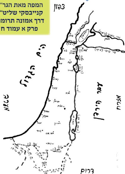
מלחם הדמים היחיד למרחב ארץ ישראל, שהתנהל בכיבוש של מ"ח עממנים בדרום על ידי בני אבות ישראלים נתינים וחיילים. המפה מתוך ספר 'מראה הגבול' בתחילת הספר. המפה מתוך ספר 'מראה הגבול' בתחילת הספר. המפה מתוך ספר 'מראה הגבול' בתחילת הספר.

המפה מאת הגר"ח קנייבסקי שליט"א דרך אמונה תרומות פרק א עמוד ח