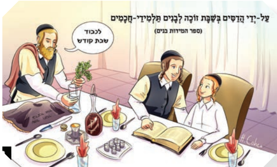
על-די גוים בשבת זוכה לנגים מלטיב-חממים (ספר המידות טובים)

קומענדיגע וואך איז עשרה בטבת. אלע אידן פאסטן און מען זאגט סליחות, ווייל אין דעם טאג האבן די גוים צעבראכן די חומות פון ירושלים און