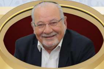
רחמים מלך ראש העיר החובת על הניסים ועל הנפלאות

פרשת מקץ תחול תמיד בשבת חנוכה, ולדעתי יש טעם לדבר.