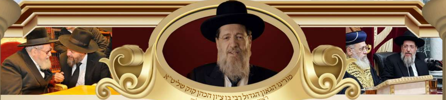
מורינו הגאון הגדול רבי בני ציון הכהן קוק שליט"א ראש בית ההוראה הכללי בירושלים רב מרכז העיר פתח תקוה