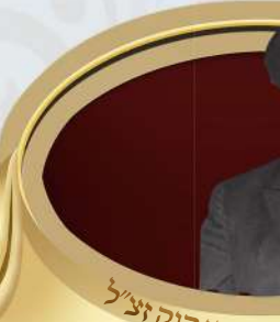
הכהן קוק זצ"ל רהובת שלמה