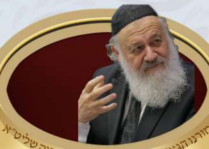
מורנו הגאון רבי אברהם יצחק הכהן קוק שליט"א ראש ישיבת מאנור התלמוד שדה אברהם