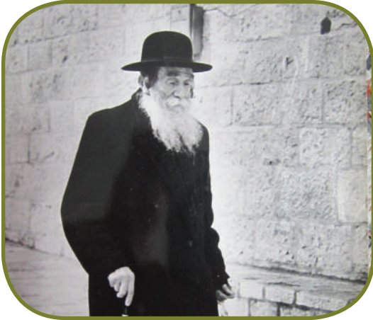
בקיאות עצומה בספרים. הגרא"א ספקטור זצ"ל בדרך לכותל המערבי

עקב המצב נותר באומן גם לראש השנה תרפ"א, ורק לאחר מכן הצליח לשוב בשלום לביתו שבפולין.