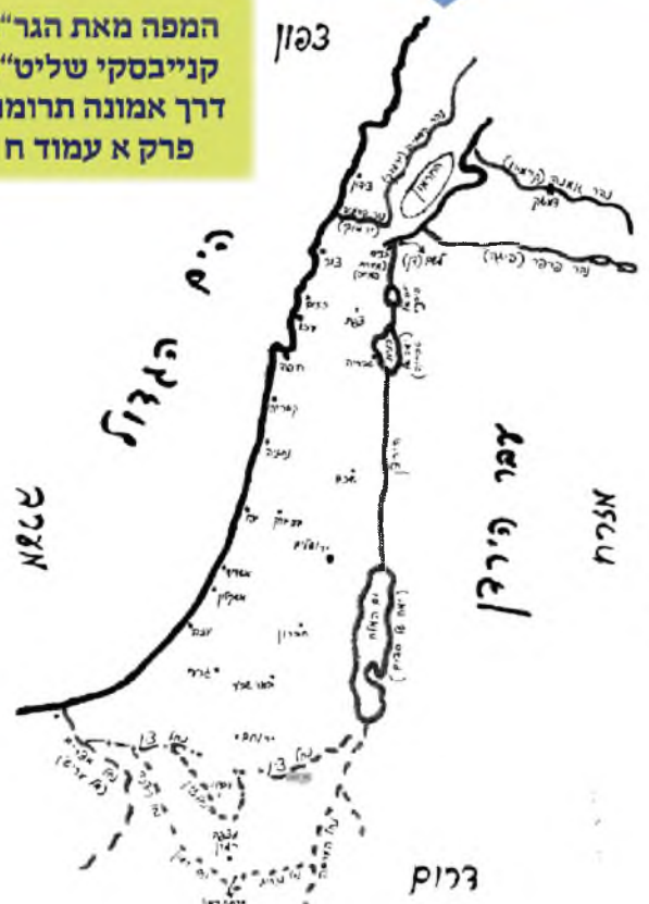
עלון הדברים היזיל לנחמה עט"ר חס חסומה, עממה כל מ"ס עמון סוגול הרווח כל א"י כן אכנס הנרנים נגיים ותיקדקם של מקורות לאמנם כלל ירושלה חוספסל ונאמנים האמנים עם כל אלה נהייתו נעמי סבלס נאמסל סבלס ונחמן קן (נעיד אלה מיד ספיקא לא נפקי עד יום וזרה נוק. נרמם הנרמם ימירימי"א וקף שלם אל"פ"ב:

המפה מאת הגר"ח קנייבסקי שליט"א דרך אמונה תרומות פרק א עמוד ח