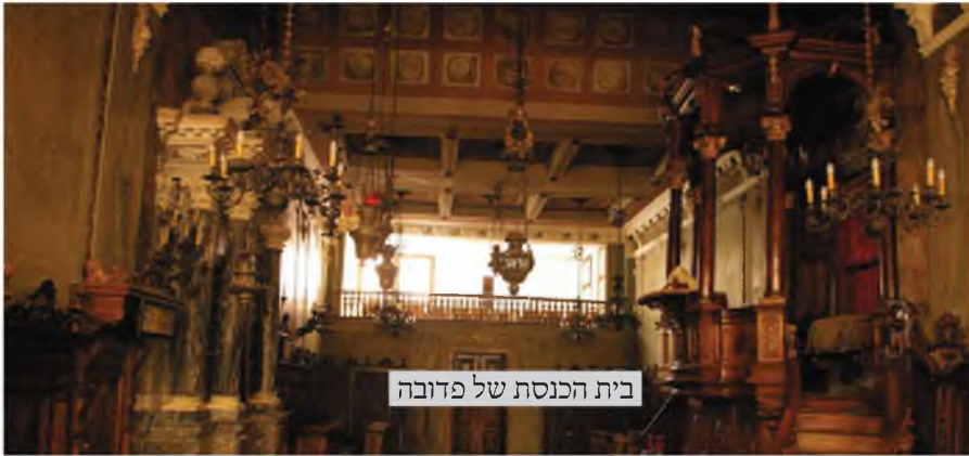
בית הכנסת של פדובה