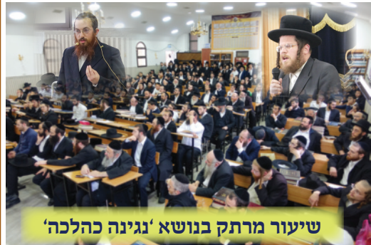
שיעור מרתק בנושא 'נגינה כהלכה'

שְׁהַלַּל: מבואר בנמ' (ברכות דף מ: ורש"י שם ד"ה מירבא) ונפסק ברמב"ם (ברכות פרק ח הלכה ח) ו בטוע' (סימן רד סעיף א), על כמהין ופטריות מבוך שְׁהַלַּל. למרות שנחשבים גידולי קרקע (שהנודר 'מפירות הארץ', אסור בפירות הארץ ומותר בכמהין ופטריות, ואם אמר 'כל גדולי קרקע עלי' אסור אף בכמהין