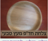
צלחת חד'פ' מעץ טבעי

חשון תשפ"ב; בכלים וצלחות חד פעמיים מעץ, נמצאו חרקים קטנים "פסוקאים" (כיני ספרים) בצבע אפור-קדם באורך מילימטר אחד. אופן ההבחנה - לאחר פתיחת האריזה, מחזיקים קבוצת צלחות במאוזן, מנערים אותם על משטח לבן ומתבוננים אם נפלו חרקים. בשל הקושי להבחין בחרקים הקטנים, נמומץ שלא להשתמש בכלים אלו!