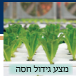
מצע גידול חסה