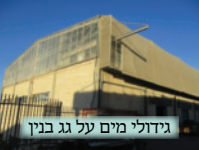
גידולי מים על גג בנין