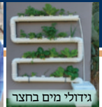
גידולי מים בחצר