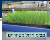
מצעי גידול מסחריים