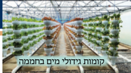
קומות גידולי מים בחממה