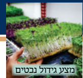
מצע גידול נבטים

שכתוב ברשימות (מפי השמועה) שהחזון איש הורה, שאין הבדל בין עציץ עם עפר לעציץ עם מים. ולא חילק בין גידולי מים לגידול באדמה, ובפרט שבאמריקה מפתחים מאד את הגידול באופן כזה. וכן שהיתה שאלה אצל החזו"א האם הגג שעשו בחפץ חיים "לגידולי מים" (שק יוטה) נחשב אכן לגג שדינו כבית. והעיר, ממה שכתב החזו"א (סימן כ"ה) שאסור רק מדברג, ובגללים אפשר שאפילו לזרוע לגדל מותר, דלא גזרינן בעציץ שאינו נקוב.