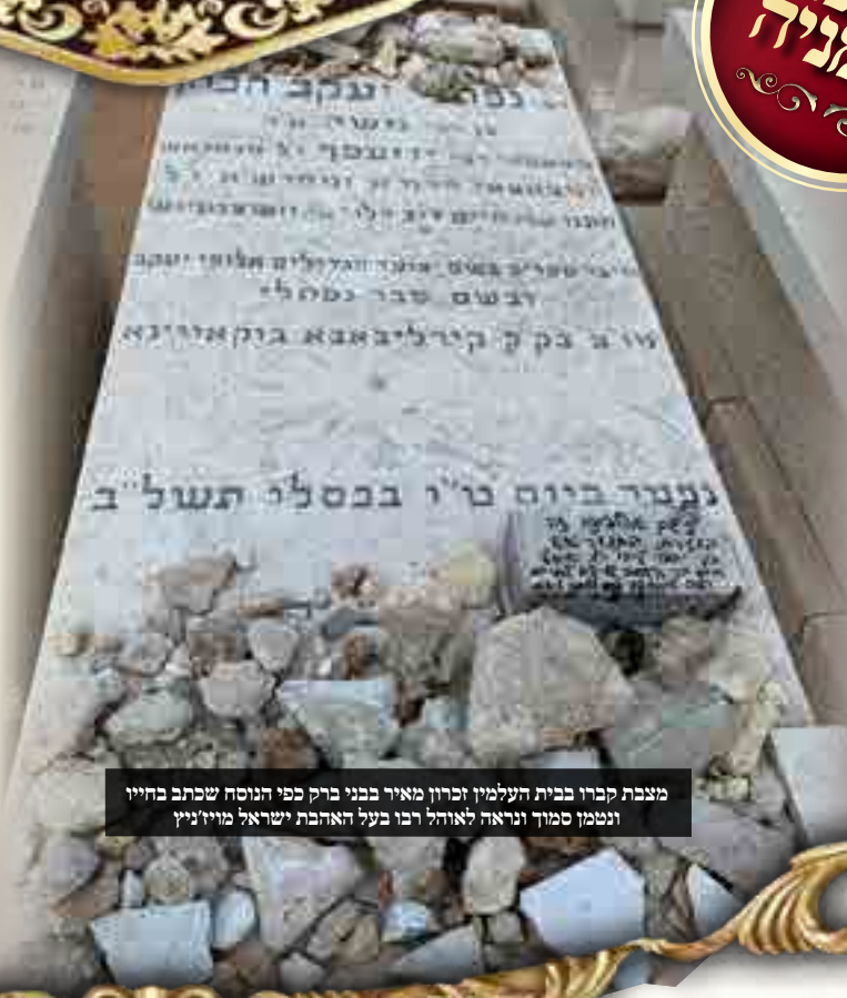
מצבת קברו בבית העלמין זכרון מאיר בבני ברק כפי הנוסח שכתב בחייו ונשמך סמוך ונראה לאוהל רבו בעל האהבת ישראל מויז'ניץ