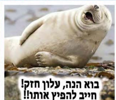
בוא הנה, עלון חזק! חייב להפיץ אותו!!

המות: זהו אנחנו אחרי החגים אפשר להתחיל דיאטה סופגניות: שלוםסססססססס