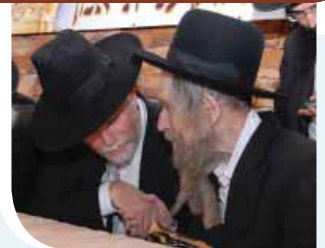
ב"ד בכסלו תשע"ח