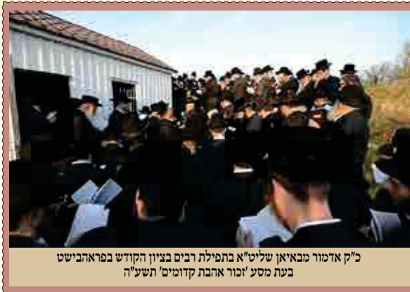
כ"ק אדמו"ר מבאיא שליט"א בתפילת רביס בציון הקודש בפראהבישט בעת מסע 'זכור אהבת קדושים' תש"ע

ועיין בספח"ק בת עין תצוה ד"ה ואתה תצוה) שכתב: דהנה כתיב (בראשית א א) "בראשית ברא" ואמרו חז"ל (זוהר חדש י.) 'בשביל יראה שנקראת ראשית', כמו שנאמר (תהלים קיא י) "ראשית חכמה יראת ה'", 'בשביל יראת ה' ברא אלקים את' כו'. פירוש שיעקר בריאת שמים וארץ כבדי שיהיה לאדם יראת ה' יראה עילאה יראת בשת, שיתבונן תמיד איך שהבורא יתברך מלא כל הארץ כבודו ולית אתר פניו מיניה, והוא מושל ומחיה את כל העולם בכל עת ורגע, וכשיתבונן תמיד בכל עת בזה אזי בודאי יפול עליו אימתה ופחד ויראה ובושה מפניו יתברך, ואחר כך יאהב אותו יתברך (בהתבוננו בחסדו הגדול) כו', וישתוקק לדבק בו יתברך על ידי תורה ומצוות. וכן תמיד ירגיל אדם את עצמו להתבונן בגדולתו יתברך עד שיגיע למדת היראה יראת בשת, ומזה יגיע אחר כך למדת אהבה אמתית להשתוקק בו יתברך עד כלות הנפש, כי זהו עיקר העבודה וזה תכלית ועיקר בריאת שמים וארץ, 'בראשית בשביל היראה שנקראת ראשית', כמאמר הכתוב (תהלים קיא כ) "זה השער לה' צדיקים יבואו בו, ומיראה יגיע לבחינת אהבה, עכ"ל.