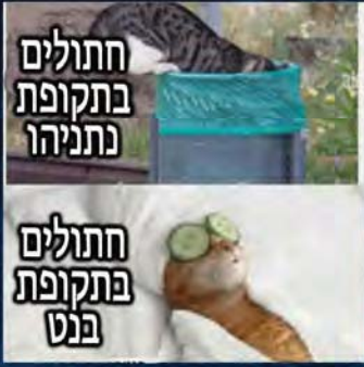
חתולים בתקופת נתניהו