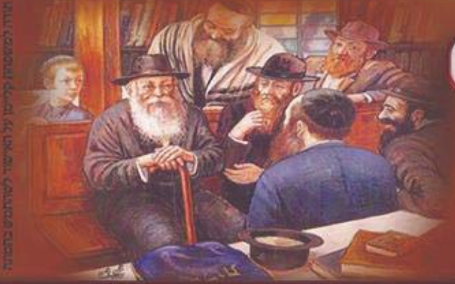
תורה למשפחה לקיים על האישור לפרויקט המבית